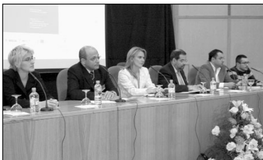
Mesa redonda "Experiencias Profesionales: retos de futuro" con la presencia de periodistas, directores de cine y empresas.

Periodistas, profesionales de los medios de comunicación, personal vinculado a la comunicación externa de entidades públicas y privadas, profesionales en materia de discapacidad y estudiantes, se reunieron para conocer de cerca como